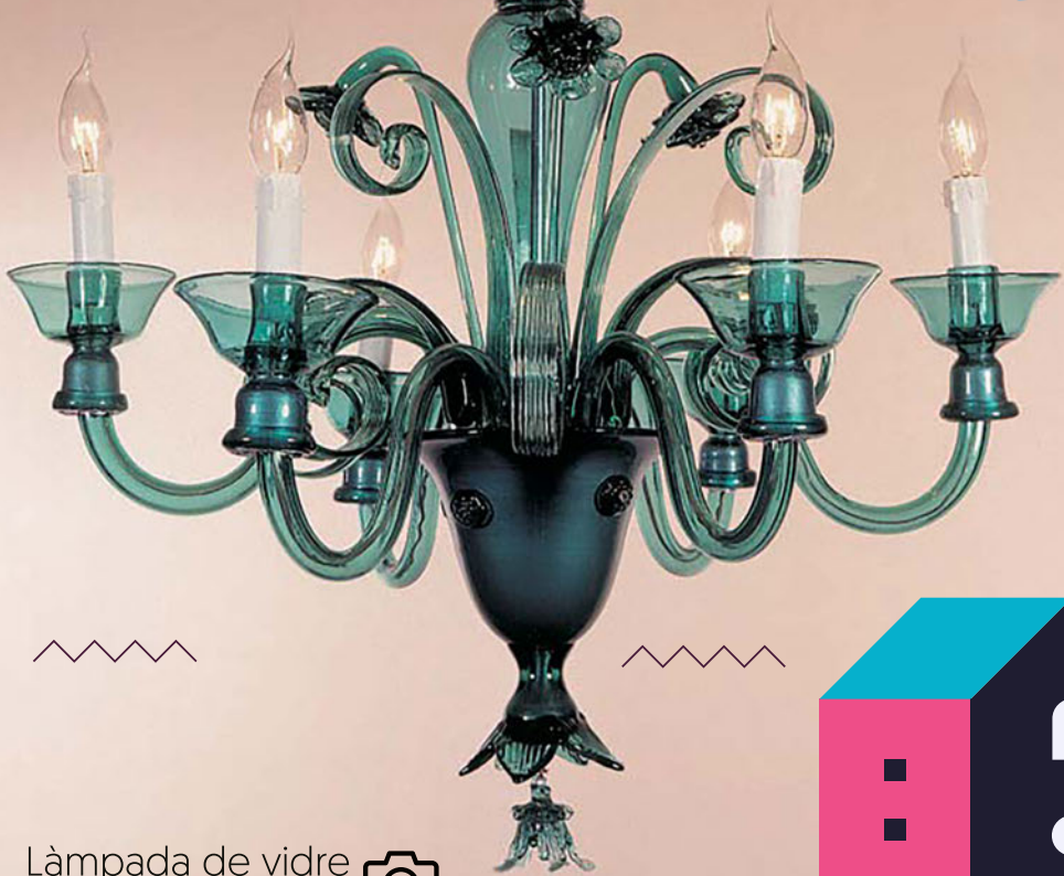
Làmpada de vidre bufat de Gordiola