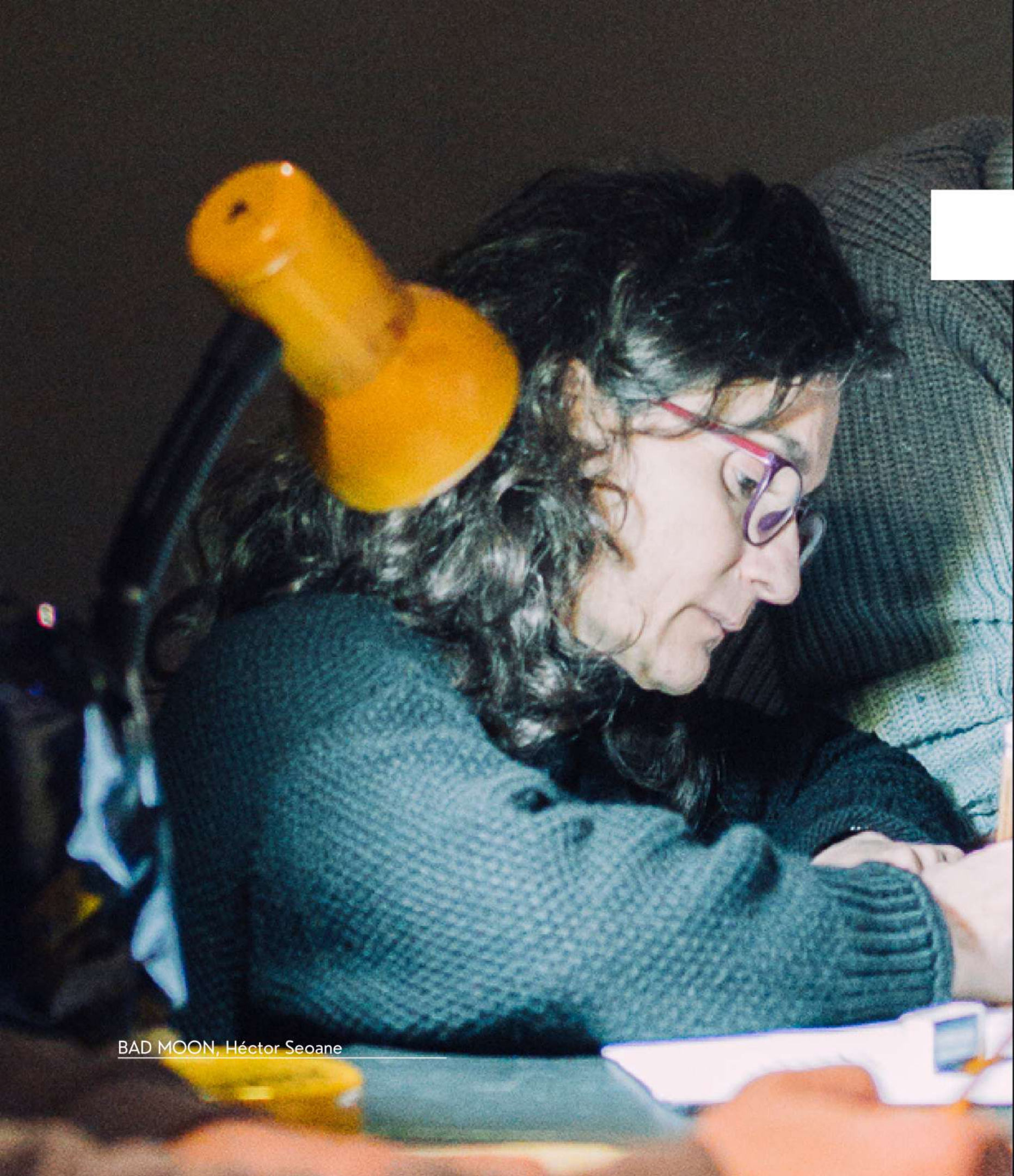
BAD MOON, Héctor Seoane