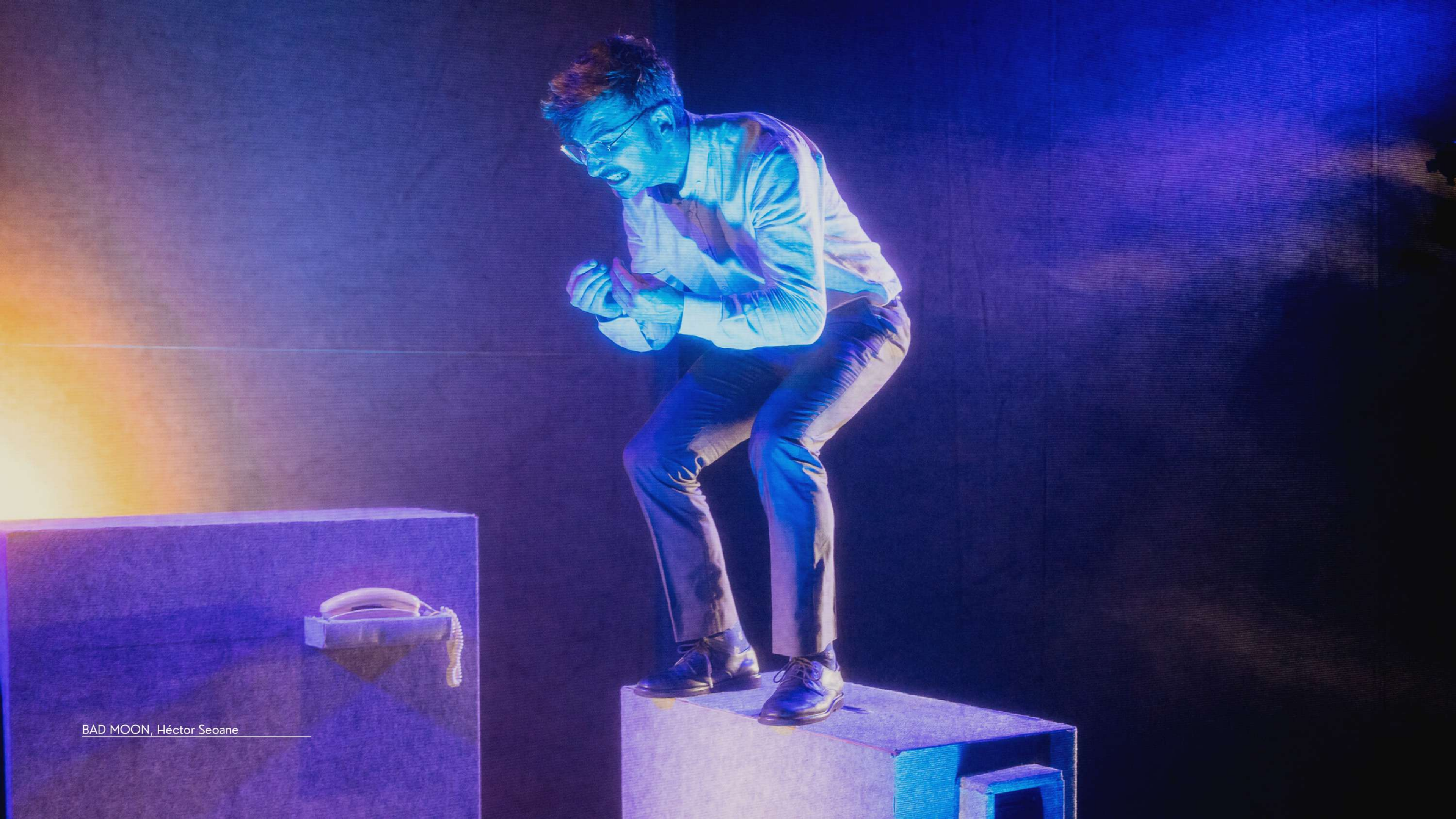
BAD MOON, Héctor Seoane